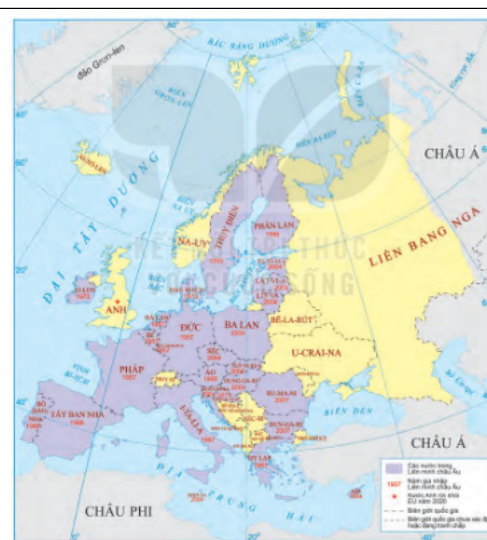
Hình 1. Bản đồ các thành viên của Liên minh châu Âu, năm 2020