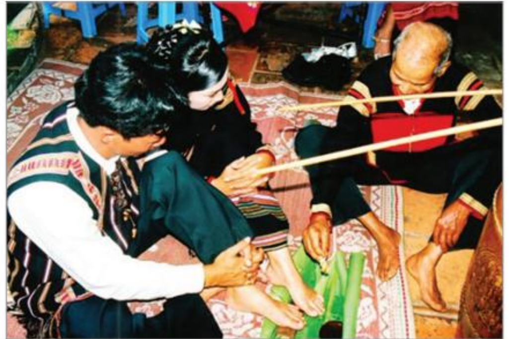
Hình 6.1. Lễ cưới của người Êđê