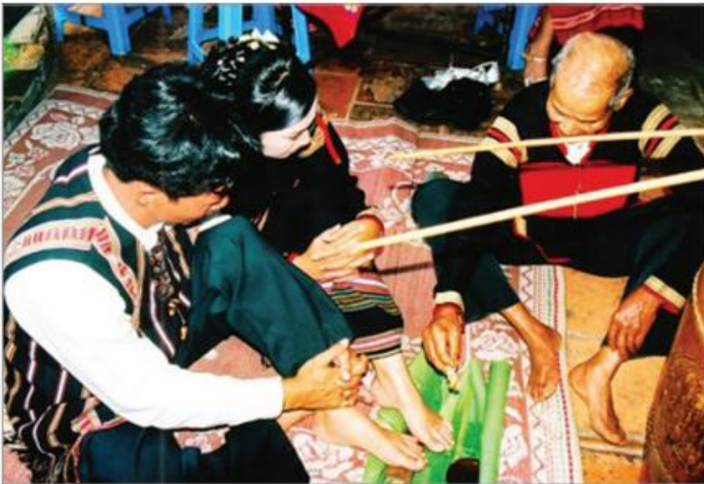
Hình 6.1. Lễ cưới của người Êđê