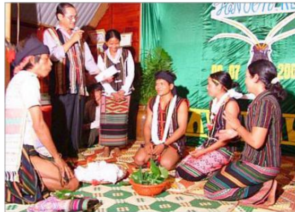
Hình 6.2. Lễ cưới của người Mnông

Kể tên một số phong tục của dân tộc em hoặc của dân tộc khác ở Đăk Lăk mà em biết?