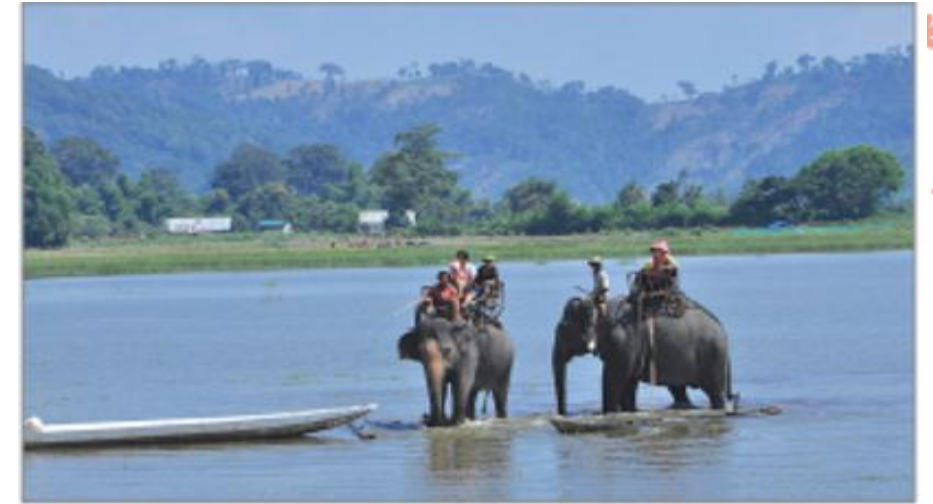
Hình 4.6. Hồ Lắk (thị trấn Liên Sơn, huyện Lắk)