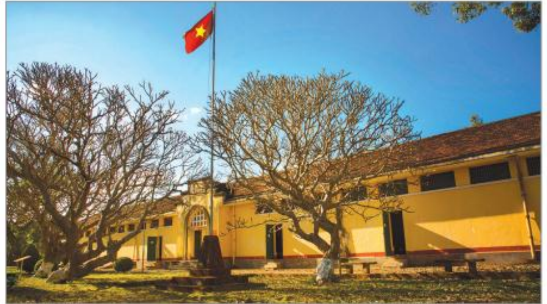
Hình 4.5. Nhà đày Buôn Ma Thuật (phường Tự An, thành phố Buôn Ma Thuật)