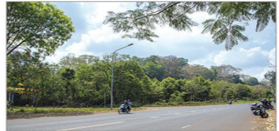
Hình 4.7. Đồi Cũ H'lăm (thị trấn Ea Pốk, huyện Cư M'gar)