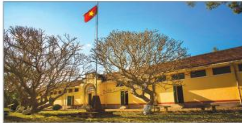
Hình 4.5. Nhà đày Buôn Ma Thuột (phường Tự An, thành phố Buôn Ma Thuột)