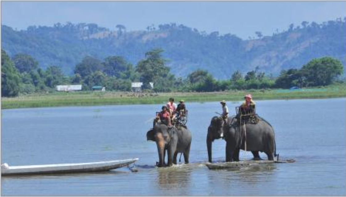
Hình 4.6. Hồ Lắk (thị trấn Liên Sơn, huyện Lắk)