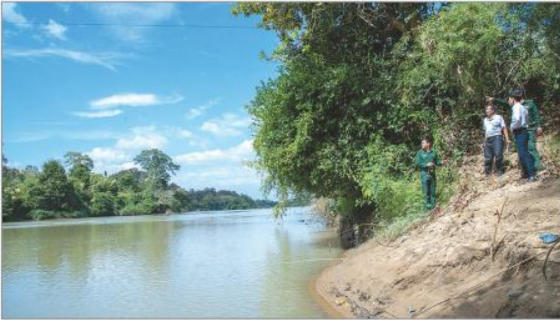
Hình 4.4. Đường Trường Sơn – Bến phà đường Hồ Chí Minh (xã Krông Na, huyện Buôn Đôn)