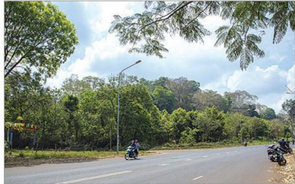
Hình 4.7. Đồi Cũ H'lăm (thị trấn Ea Pốk, huyện Cư M'gar)