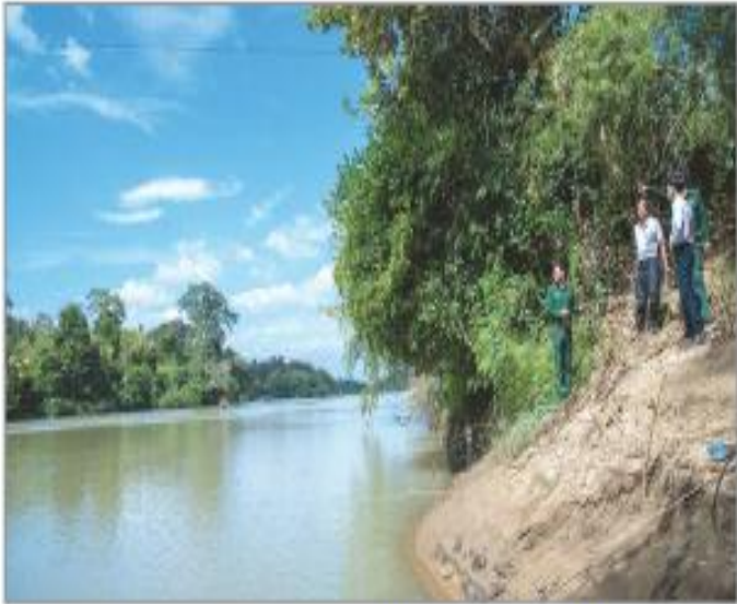
Hình 4.4. Đường Trường Sơn – Bến phà đường Hồ Chí Minh (xã Krông Na, huyện Buôn Đôn)