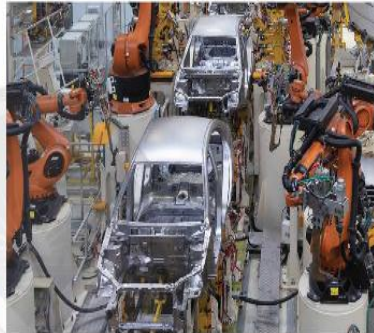
b) Dây chuyền lắp ráp ô tô tự động bằng robot