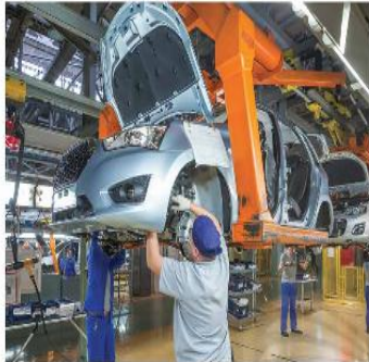
a) Dây chuyền lắp ráp ô tô có sự tham gia của con người