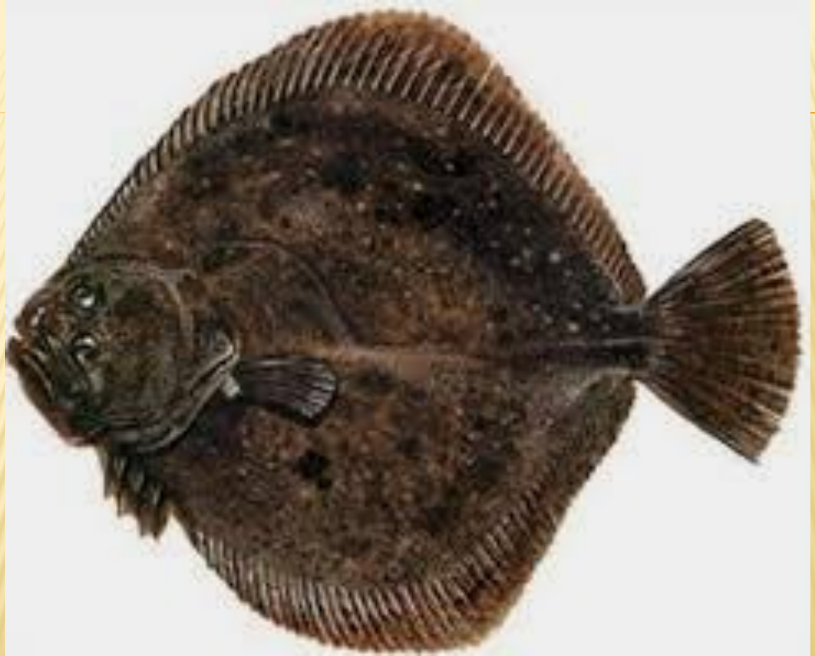
cá thờn bơn