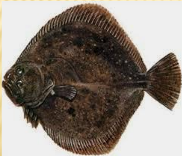
cá thồn bơn