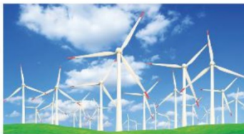
▲ Hình 1.9. Sử dụng năng lượng gió để sản xuất điện