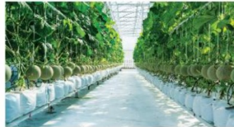
▲ Hình 1.7. Trồng dưa lưới