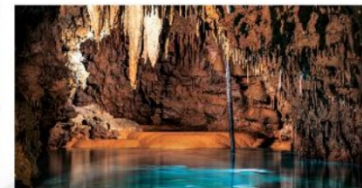
▲ Hình 1.10. Thạch nhũ tạo ra trong hang động