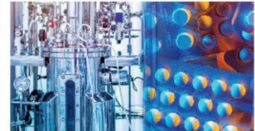
▲ Hình 1.8. Thiết bị sản xuất dược phẩm