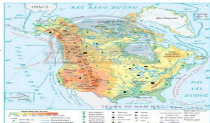
Hình 14.1. Bản đồ tự nhiên khu vực Bắc Mỹ

Bước 3: Giáo viên chốt ý và dẫn dắt vào bài.