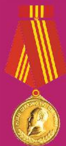
HUÂN CHƯƠNG HỒ CHÍ MINH